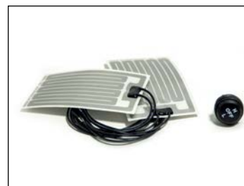
Kahvanlämmittinsarja ... 79 € Snarler-malleihin