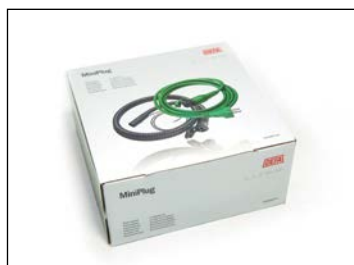
Mootorinlämmittimen johtosarja ..... 94 €