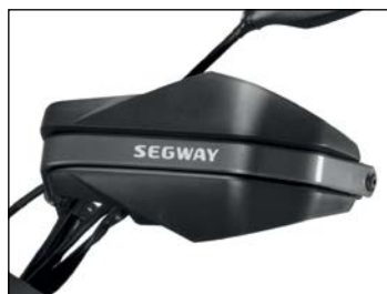
Käsisuoja ..... 140 € Snarler-malleihin, vakiona Full Version -malleissa