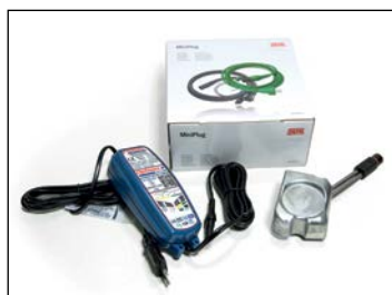
Winter kit ..... 349 € Sis. mootorinlämmittimen, johtosarjan sekä ylläpitola- turin. Snarler AT6 -malleihin.