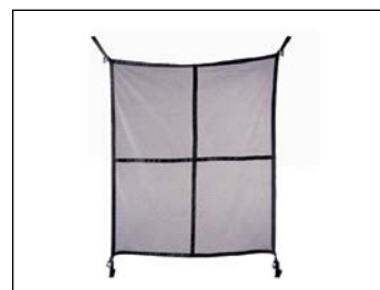
Tavaraverkko lavalle ... 99 € Fugleman-malleihin.