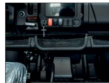
Verkkotaskut 3 kpl ..... 49 € Kojelautaan kiinnitettävät. Fugleman-malleihin.