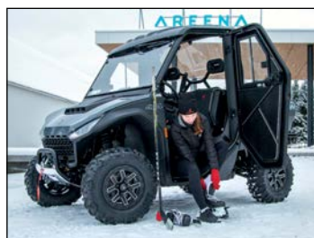
Lämpöhyttipaketti ..5 500 € (Ovh. 8 000 €) Fugleman-malleihin. Sisältää lämpöhytin ja lämmittimen.