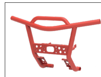
Puskuri ..... 139 € Snarler-malleihin, Värit: oranssi ja vihreä