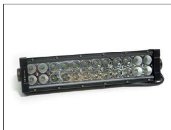
Kaukovalopaneeli ..... 109 € LED 72 W. Kytettävissä esim. "lisäpitkäksi"