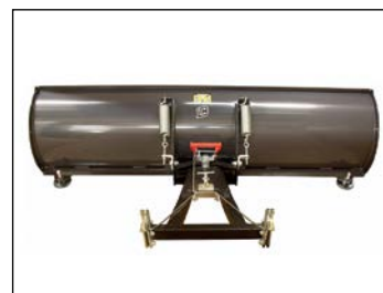
Lumilevysarja ..... 1 060 € Sisältää mallikohtaisen asennussarjan