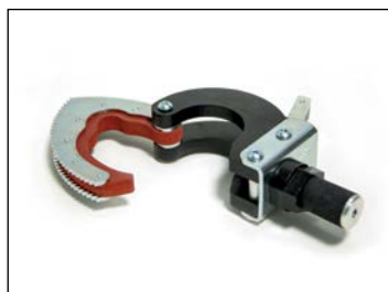
Työkaluteline ..... 75 € Esim. lapion kuljettamiseen mönkijän kydyssä