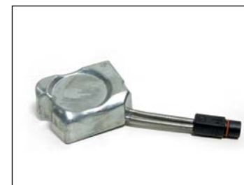
Mootorinlämmitin .... 248 € Defa 230 V, helpottaa kylmäkäynnistystä. Snarler AT6 -malleihin.