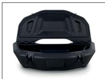
Takalaatikko ..... 329 € Snarler-malleihin, tilavuus 104 litraa