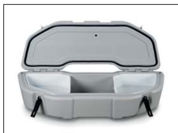
Etulaatikko ..... 289 € Snarler-malleihin, tilavuus 37,5 litraa